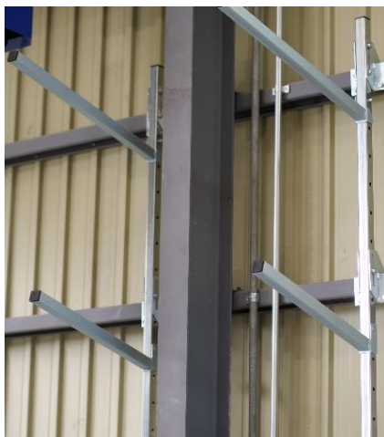
小さい柱であればまたいで 設置することができます