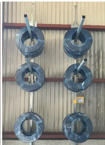
脚立や木材等の長物収納や電線等の収納に