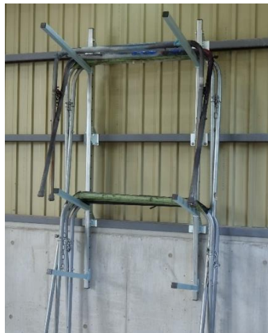
パーツスタンドの収納に